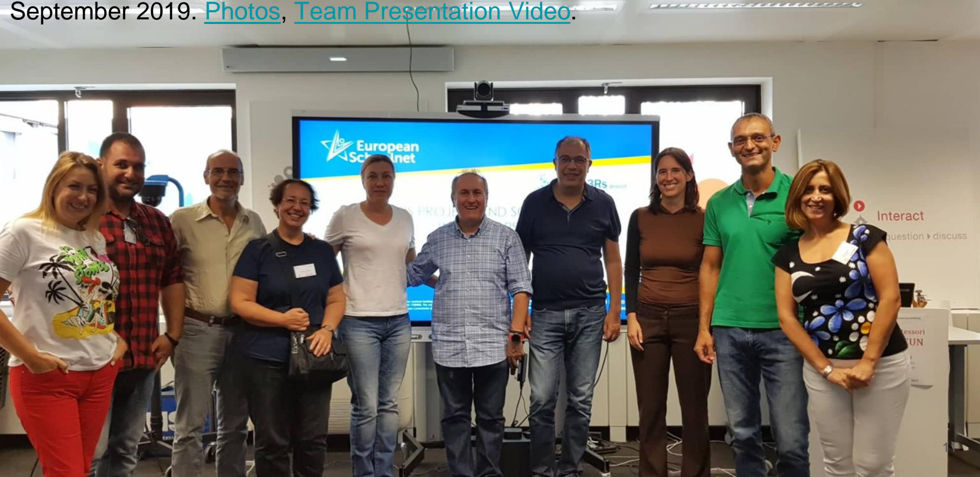
18. Participation at EUN Partnership - SPW32 / 3Rs project / Brussels, Belgium. 13-15 September 2019. Photos , Team Presentation Video .